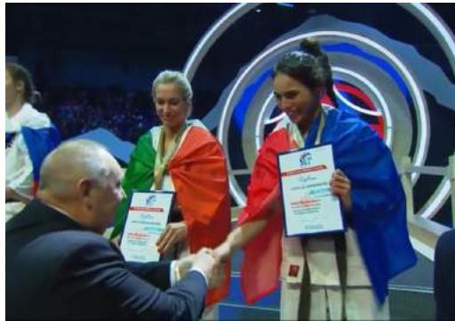
Championnat du Monde