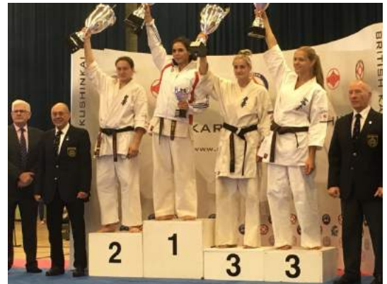
Championnat d'Europe IFK